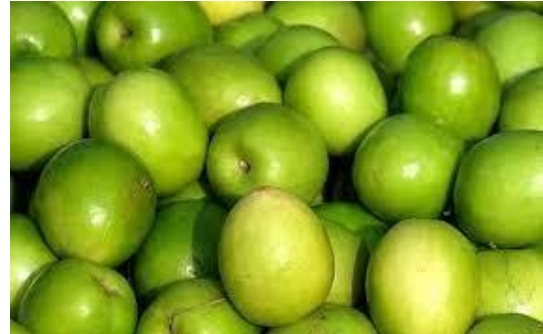
बेर की खेती

बेर एक प्रसिद्ध फल है जिसकी खेती राजस्थान में जयपुर जिले में बहुत ही आसानी से की जा सकती है। इसके फलों को प्रयोग ताजे फलों के रूप में खाने, सुखाकर छुआरों के रूप में, शर्बत, जैम, मुर्ब्बा, केण्डी, चटनी एवं आचार बनाकर किया जाता है। इसके अतिरिक्त बेर के पौधे का लाख के कीड़ों को पालने में और इसके पत्ते का प्रयोग पशुओं के चारे के रूप में किया जाता है। इसकी लकड़ी जलाने के उपयोग में भी ली जाती है।